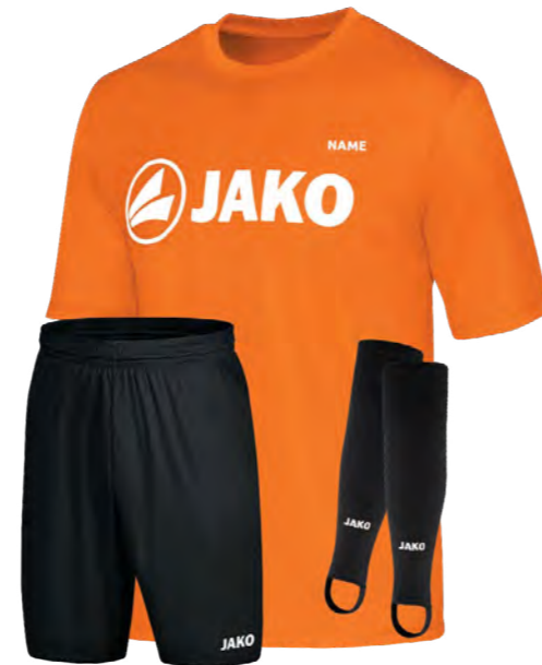
Das Trainingsset beinhaltet das Fußballcamp

Die Betreuungszeiten sind täglich von 9.00 Uhr bis 16.00 Uhr.