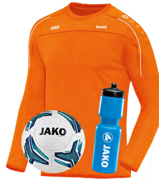
Das Trainingsset beinhaltet das Fußballcamp